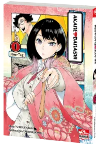
Akane-banashi 01 Taschenbuch