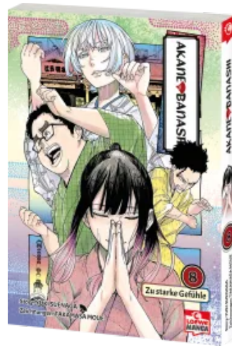
Akane-banashi 08 Taschenbuch