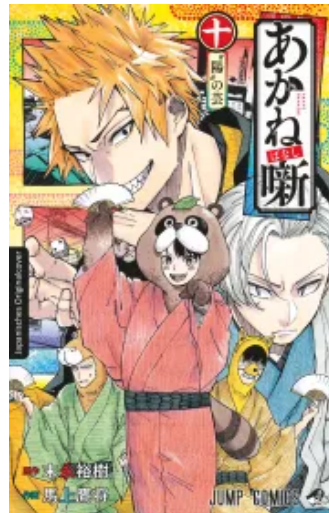
Akane-banashi 10 Taschenbuch