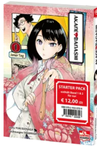
Akane-banashi Starter Pack Taschenbuch