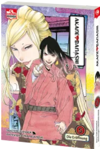
Akane-banashi 05 Taschenbuch