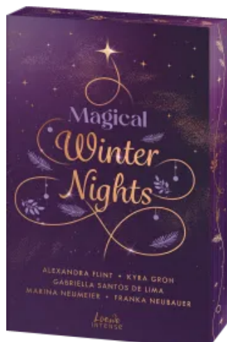
Magical Winter Nights Paperback