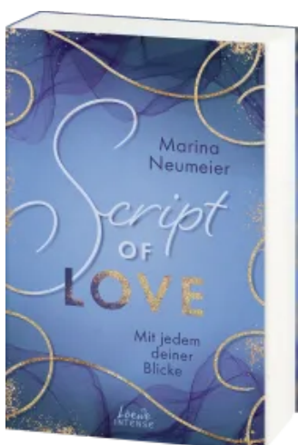
Script of Love - Mit jedem deiner Blicke (Love-Trilogie, Band 2) Paperback