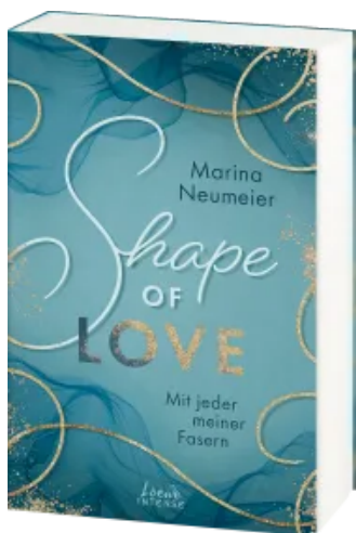
Shape of Love - Mit jeder meiner Fasern (Love-Trilogie, Band 1) Paperback