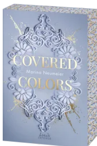
Covered Colors (Golden Hearts, Band 2) Paperback