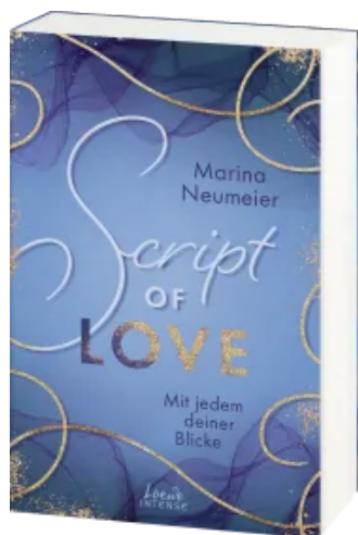
Script of Love - Mit jedem deiner Blicke (Love-Trilogie, Band 2) Paperback