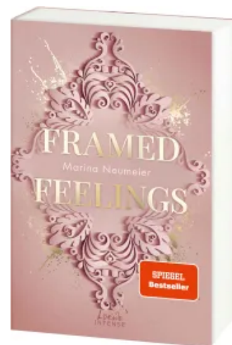
Framed Feelings (Golden Hearts, Band 1) Paperback