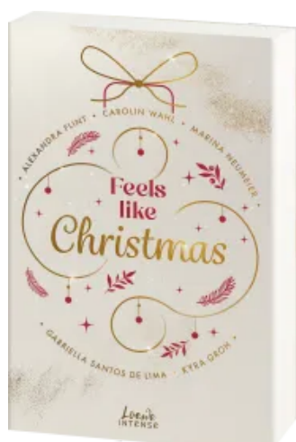
Feels like Christmas Paperback