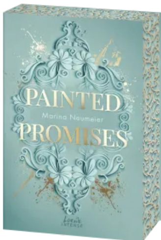
Painted Promises (Golden Hearts, Band 3) Paperback