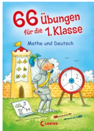
66 Übungen für die 1. Klasse - Mathe und Deutsch Taschenbuch