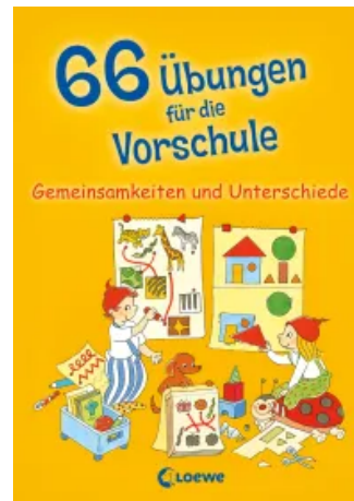
66 Übungen für die Vorschule - Gemeinsamkeiten und Unterschiede Taschenbuch