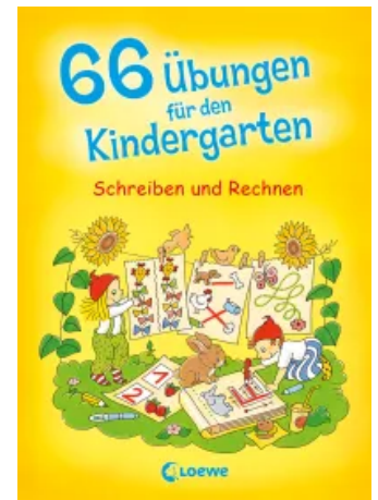
66 Übungen für den Kindergarten Taschenbuch