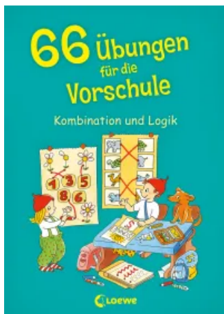
66 Übungen für die Vorschule Unbekannt