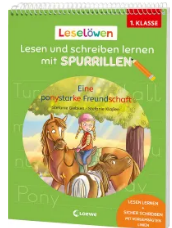
Leselöwen - Lesen und schreiben lernen mit Spurrillen - Eine ponystarke Freundschaft Taschenbuch