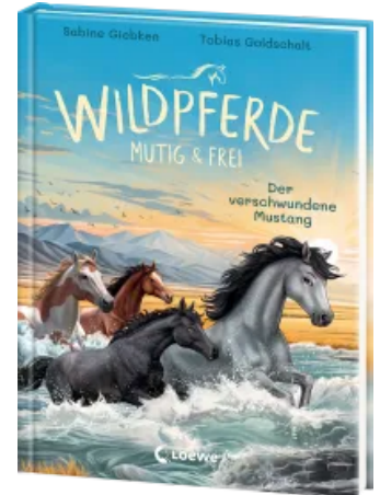
Wildpferde - mutig und frei (Band 4) - Der verschwundene Mustang Hardcover