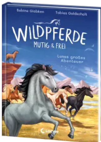
Wildpferde - mutig und frei (Band 1) - Lunas großes Abenteuer Hardcover