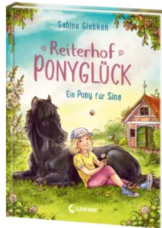
Reiterhof Ponyglück (Band 1) - Ein Pony für Sina Hardcover