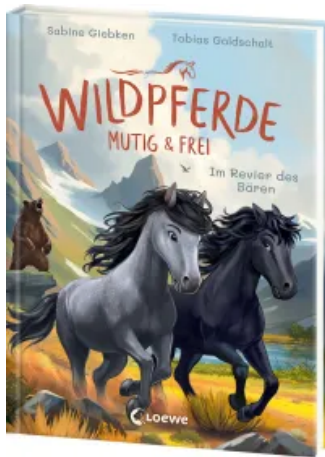
Wildpferde - mutig und frei (Band 6) - Im Revier des Bären Hardcover