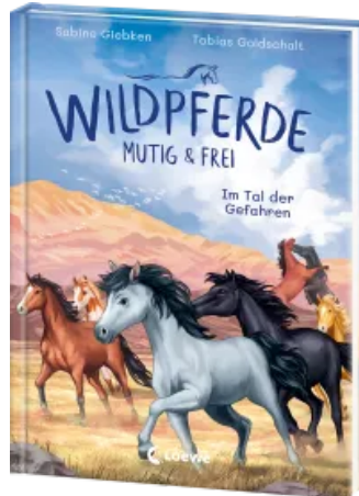
Wildpferde - mutig und frei (Band 2) - Im Tal der Gefahren Hardcover