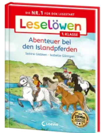
Leselöwen 1. Klasse - Abenteuer bei den Islandpferden Hardcover