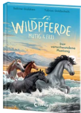
Wildpferde - mutig und frei (Band 4) - Der verschwundene Mustang Hardcover