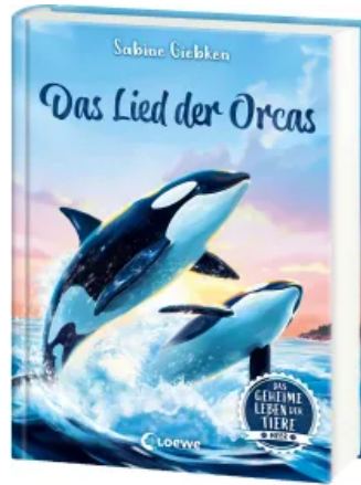
Das geheime Leben der Tiere (Meer) - Das Lied der Orcas Hardcover