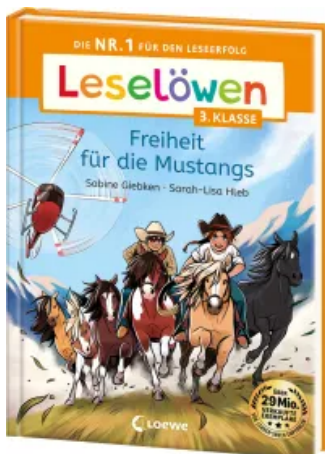
Leselöwen 3. Klasse - Freiheit für die Mustangs Hardcover