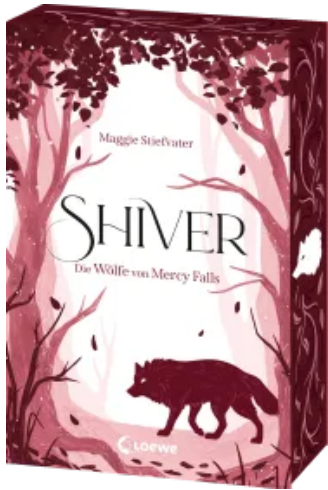
Shiver (Die Wölfe von Mercy Falls, Band 1) Paperback