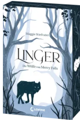
Linger (Die Wölfe von Mercy Falls, Band 2) Paperback