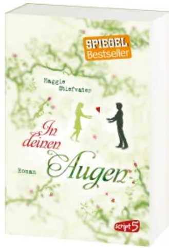
In deinen Augen Taschenbuch