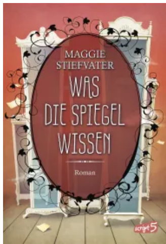
Was die Spiegel wissen (Raven Boys 3) Hardcover