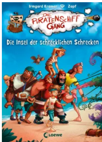
Die Piratenschiffgänger 2 - Die Insel der schrecklichen Schrecken Hardcover