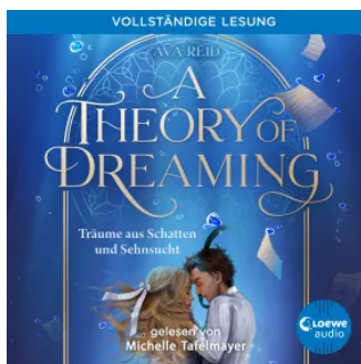
A Theory of Dreaming (A Study in Drowning, Band 2) Hörbuch