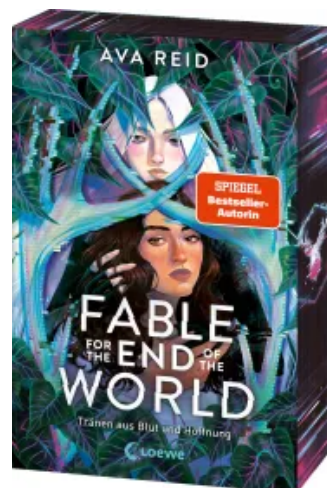
Fable for the End of the World Paperback