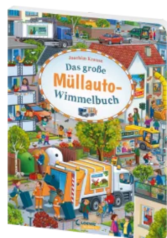
Das große Müllauto- Wimmelbuch Hardcover