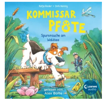
Kommissar Pfote (Band 7) - Spurensuche am Waldsee Hörbuch