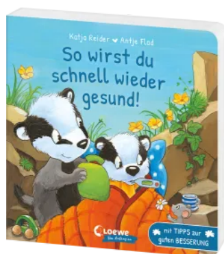
So wirst du schnell wieder gesund! Hardcover