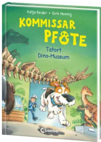
Kommissar Pfote (Band 9) - Tatort Dino-Museum Hardcover