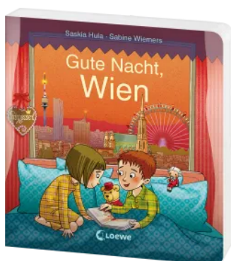
Gute Nacht, Wien Hardcover