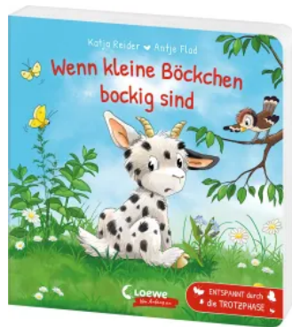
Wenn kleine Böckchen bockig sind Hardcover