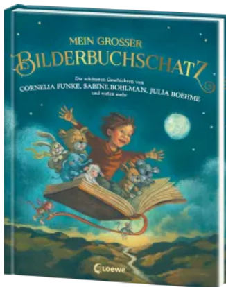
Mein großer Bilderbuchschatz Hardcover