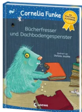
Bücherfresser und Dachbodengespenster Hardcover