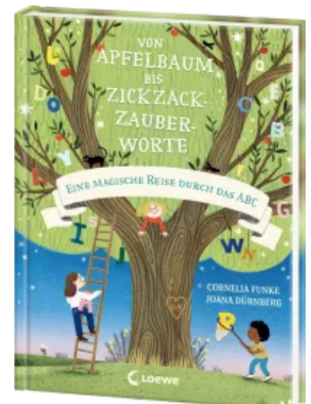
Von Apfelbaum bis Zickzackzauberworte Hardcover