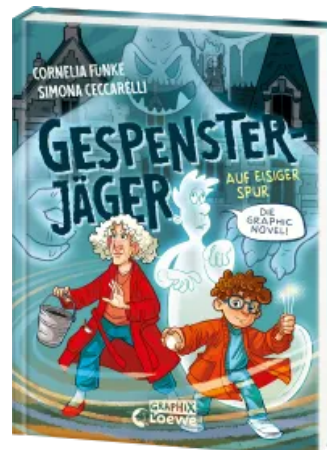
Gespensterjäger auf eisiger Spur (Band 1) - Die Graphic Novel Hardcover