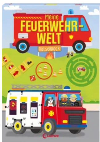
Meine Feuerwehr-Welt - Rätselblock Taschenbuch