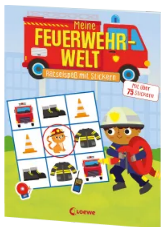
Meine Feuerwehr-Welt - Rätselspaß mit Stickern Taschenbuch