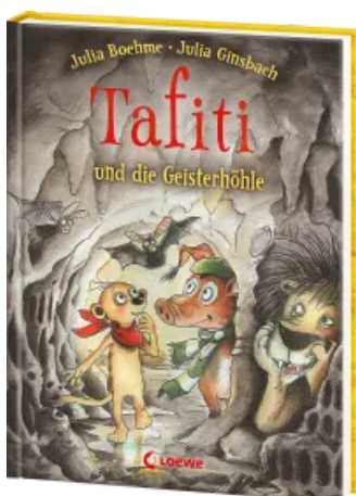
Tafiti und die Geisterhöhle (Band 15) Hardcover