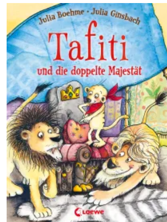
Tafiti und die doppelte Majestät (Band 9) Hardcover