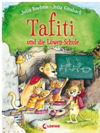
Tafiti und die Löwen-Schule (Band 12) Hardcover