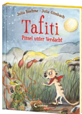
Tafiti (Band 22) - Pinsel unter Verdacht Hardcover