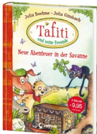
Tafiti und seine Freunde - Neue Abenteuer in der Savanne Hardcover