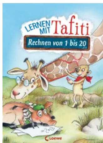
Lernen mit Tafiti - Rechnen von 1 bis 20 Taschenbuch