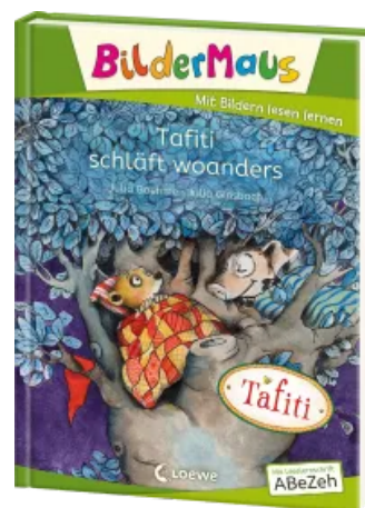
Bildermaus - Tafiti schläft woanders Hardcover