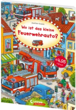
Wo ist das kleine Feuerwehrauto? Sonderausgabe