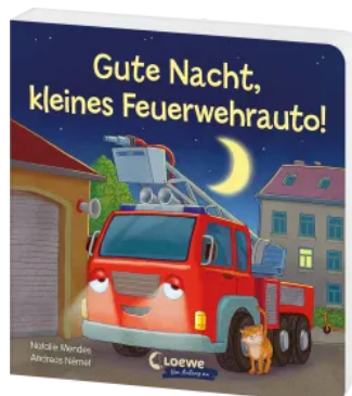
Gute Nacht, kleines Feuerwehrauto! Hardcover