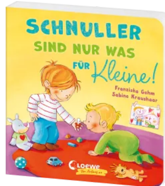
Schnuller sind nur was für Kleine! Hardcover