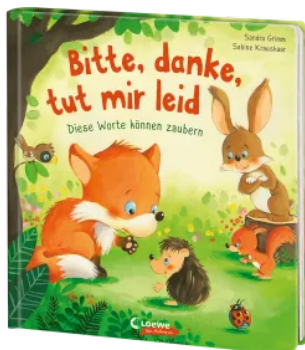
Bitte, danke, tut mir leid Hardcover