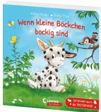
Wenn kleine Böckchen bockig sind Hardcover