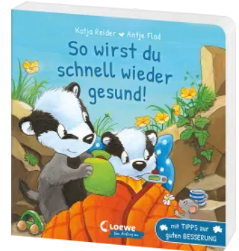
So wirst du schnell wieder gesund! Hardcover