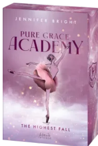
Pure Grace Academy (Band 2) - The Highest Fall Paperback