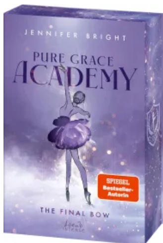
Pure Grace Academy (Band 1) - The Final Bow Paperback