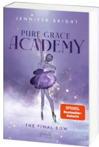
Pure Grace Academy (Band 1) - The Final Bow Paperback