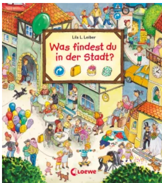
Was findest du in der Stadt? Unbekannt