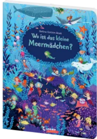
Wo ist das kleine Meermädchen? Hardcover