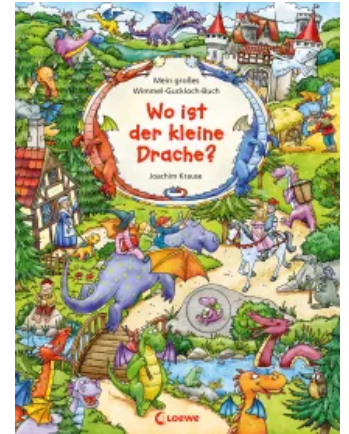
Mein großes Wimmel-Guckloch-Buch – Wo ist der kleine Drache? Unbekannt