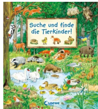
Suche und finde die Tierkinder! Unbekannt