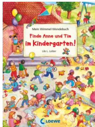
Mein Wimmel-Wendebuch - Finde Anne und Tim im Kindergarten! / Finde Anne und Tim in den Ferien! Unbekannt