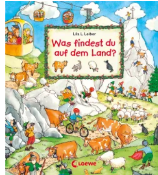
Was findest du auf dem Land? Unbekannt