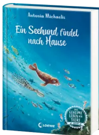
Das geheime Leben der Tiere (Ozean) - Ein Seehund findet nach Hause Hardcover