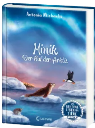
Das geheime Leben der Tiere (Ozean) - Minik - Der Ruf der Arktis Hardcover