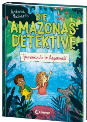
Die Amazonas-Detektive (Band 3) - Spurensuche im Regenwald Hardcover