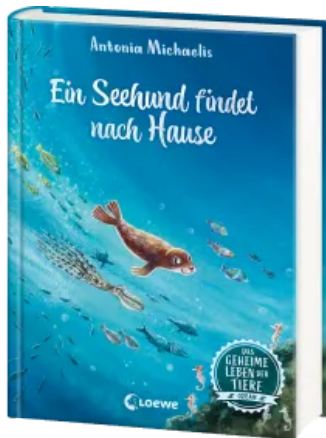
Das geheime Leben der Tiere (Ozean) - Ein Seehund findet nach Hause Hardcover