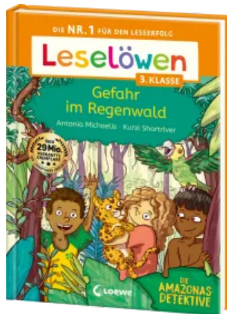
Leselöwen 3. Klasse - Amazonas-Detektive: Gefahr im Regenwald Hardcover