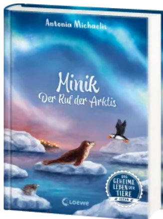
Das geheime Leben der Tiere (Ozean) - Minik - Der Ruf der Arktis Hardcover