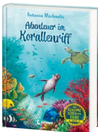
Das geheime Leben der Tiere (Ozean) - Abenteuer im Korallenriff Hardcover