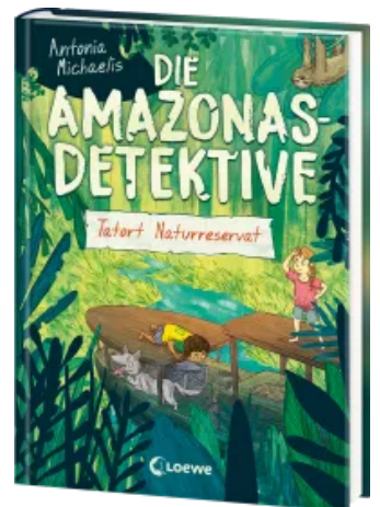
Die Amazonas-Detektive (Band 2) - Tatort Naturreservat Hardcover