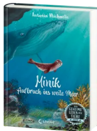
Das geheime Leben der Tiere (Ozean) - Minik - Aufbruch ins weite Meer Hardcover