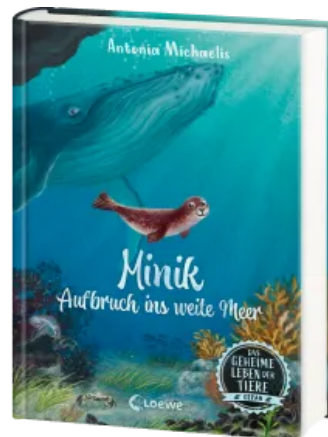
Das geheime Leben der Tiere (Ozean) - Minik - Aufbruch ins weite Meer Hardcover