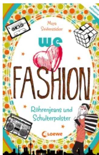
we love fashion (Band 1) – Röhrenjeans und Schulterpolster Paperback