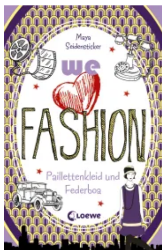
we love fashion (Band 3) – Paillettenkleid und Federboa Paperback