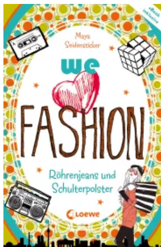
we love fashion (Band 1) – Röhrenjeans und Schulterpolster Paperback