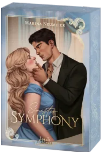
Sinister Symphony (Whispers of Scandals, Band 1) Paperback