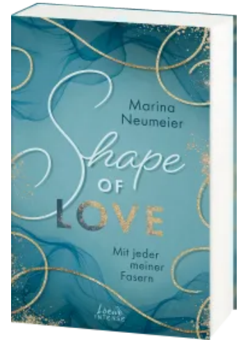
Shape of Love - Mit jeder meiner Fasern (Love- Trilogie, Band 1) Paperback