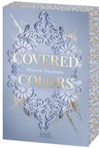
Covered Colors (Golden Hearts, Band 2) Paperback