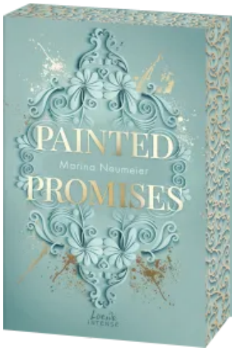
Painted Promises (Golden Hearts, Band 3) Paperback