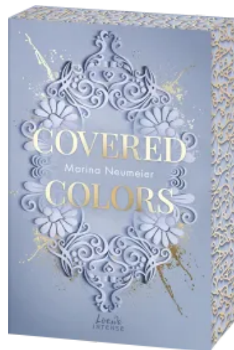
Covered Colors (Golden Hearts, Band 2) Paperback