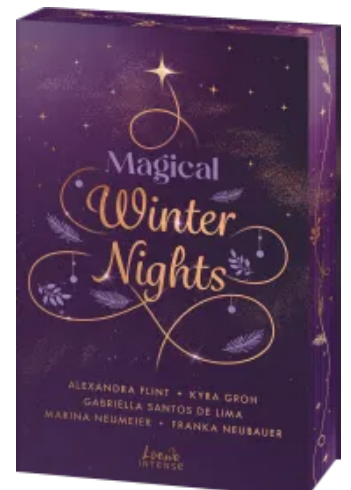
Magical Winter Nights Paperback