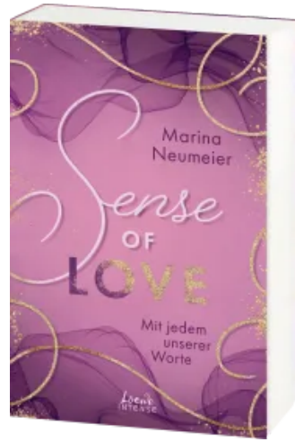
Sense of Love - Mit jedem unserer Worte (Love- Trilogie, Band 3) Paperback