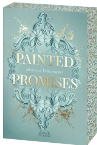
Painted Promises (Golden Hearts, Band 3) Paperback