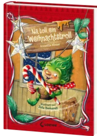
Na toll, ein Weihnachtstroll (Band 1) Hardcover