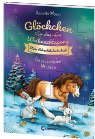
Glöckchen, das Weihnachtsspony Mein Adventskalenderbuch - Ein zauberhafter Wunsch Taschenbuch