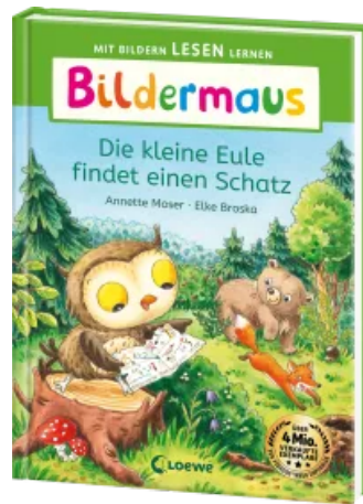
Bilderm Maus - Die kleine Eule findet einen Schatz Hardcover