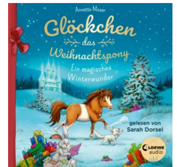
Glöckchen, das Weihnachtsspony - Ein magisches Winterwunder Hörbuch