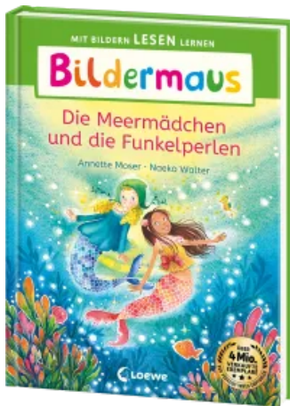
Bilderm Maus - Die Meermaidchen und die Funkelperlen Hardcover