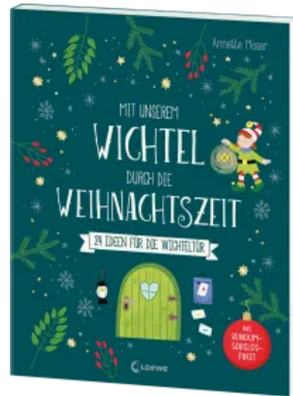
Mit unserem Wichtel durch die Weihnachtszeit Taschenbuch