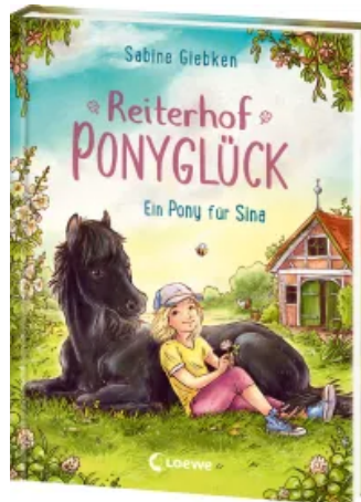
Reiterhof Ponyglück (Band 1) - Ein Pony für Sina Hardcover