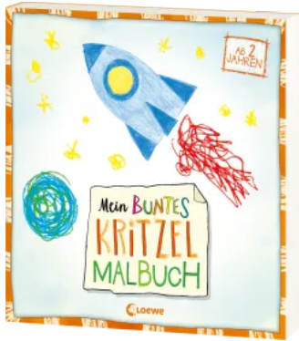
Mein buntes Kritzel- Malbuch (Rakete) Taschenbuch