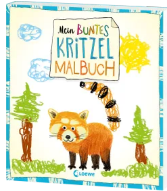
Mein buntes Kritzel- Malbuch (Roter Panda) Taschenbuch