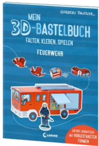
Mein 3D-Bastelbuch - Falten, kleben, spielen - Feuerwehr Taschenbuch