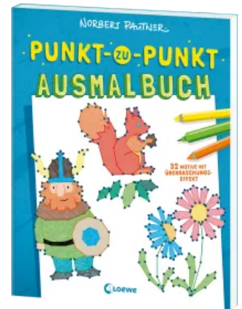
Punkt-zu-Punkt- Ausmalbuch (blau) Taschenbuch