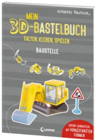
Mein 3D-Bastelbuch - Falten, kleben, spielen - Baustelle Taschenbuch