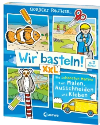
Wir basteln! XXL - Die schönsten Motive zum Malen, Ausschneiden und Kleben (blau) Taschenbuch