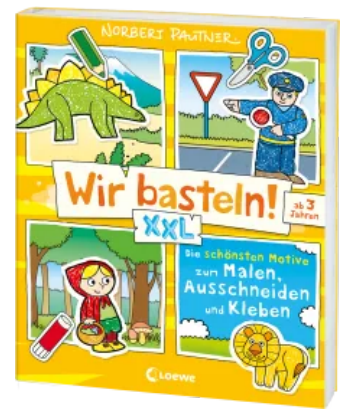
Wir basteln! XXL - Die schönsten Motive zum Malen, Ausschneiden und Kleben (gelb) Taschenbuch