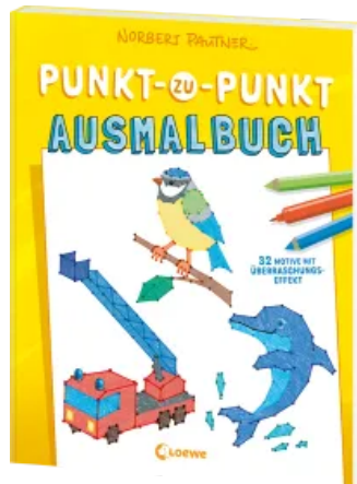
Punkt-zu-Punkt- Ausmalbuch (gelb) Taschenbuch