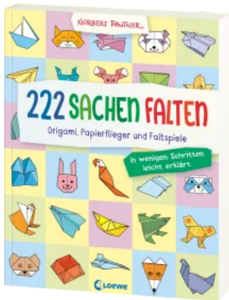
222 Sachen falten - in wenigen Schritten leicht erklärt Taschenbuch