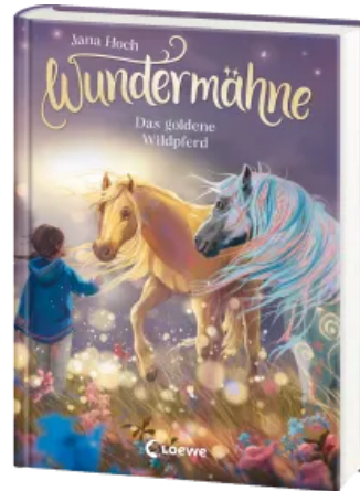
Wundermähne (Band 4) - Das goldene Wildpferd Hardcover