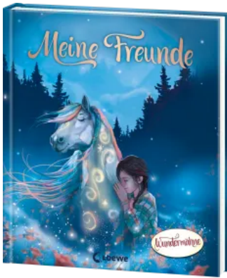
Meine Freunde (Wundermähne) Hardcover