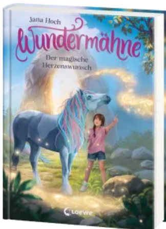
Wundermähne (Band 7) - Der magische Herzenswunsch Hardcover