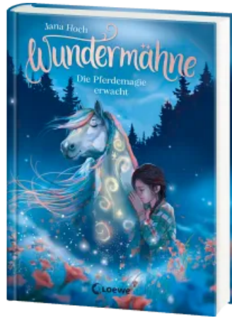
Wundermähne (Band 1) - Die Pferdemaie erwacht Hardcover