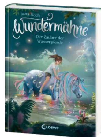
Wundermähne (Band 6) - Der Zauber der Wasserpferde Hardcover