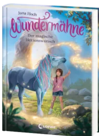
Wundermähne (Band 7) - Der magische Herzenswunsch Hardcover