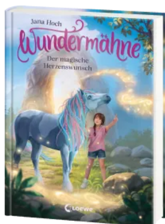
Wundermähne (Band 7) - Der magische Herzenswunsch Hardcover