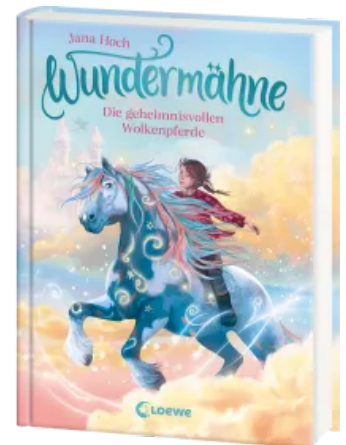
Wundermähne (Band 5) - Die geheimnisvollen Wolkenpferde Hardcover