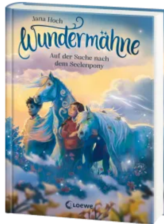
Wundermähne (Band 2) - Auf der Suche nach dem Seelenpony Hardcover