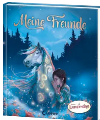
Meine Freunde (Wundermähne) Hardcover