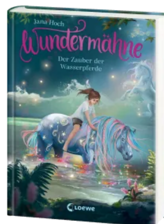
Wundermähne (Band 6) - Der Zauber der Wasserpferde Hardcover