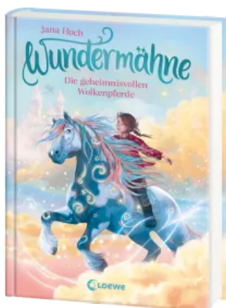
Wundermähne (Band 5) - Die geheimnisvollen Wolkenpferde Hardcover