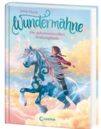
Wundermähne (Band 5) - Die geheimnisvollen Wolkenpferde Hardcover