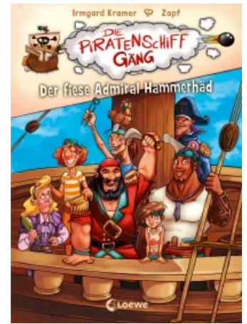
Die Piratenschiffgänger 1 - Der fiese Admiral Hammerhäd Hardcover