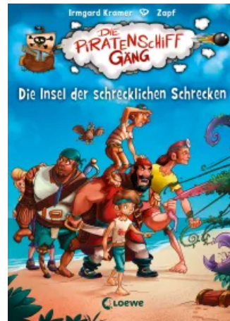
Die Piratenschiffgänger 2 - Die Insel der schrecklichen Schrecken Hardcover