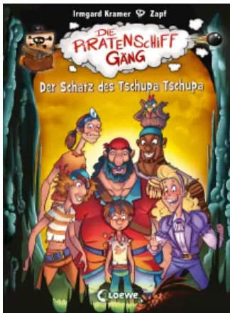
Die Piratenschiffgänger 4 - Der Schatz des Tschupa Tschupa Hardcover