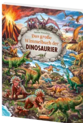
Das große Wimmelbuch der Dinosaurier Hardcover