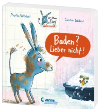
Der kleine Esel Lieber nicht - Baden? Lieber nicht! Hardcover