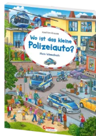
Wo ist das kleine Polizeiauto? Hardcover