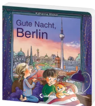
Gute Nacht, Berlin Hardcover