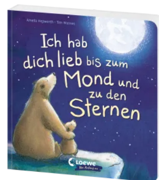
Ich hab dich lieb bis zum Mond und zu den Sternen Hardcover