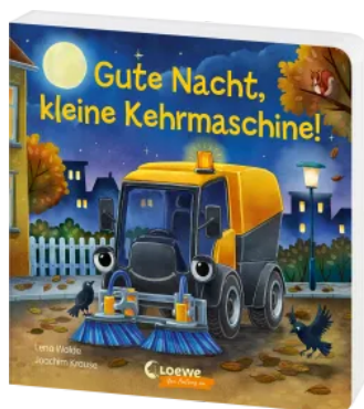
Gute Nacht, kleine Kehrmaschine! Hardcover