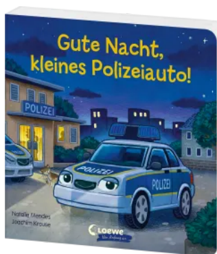
Gute Nacht, kleines Polizeiauto! Hardcover