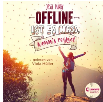
Offline ist es nass, wenn's regnet Hörbuch