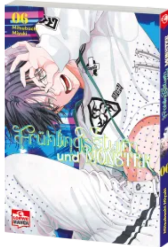
Frühlingssturm und Monster 06 Taschenbuch