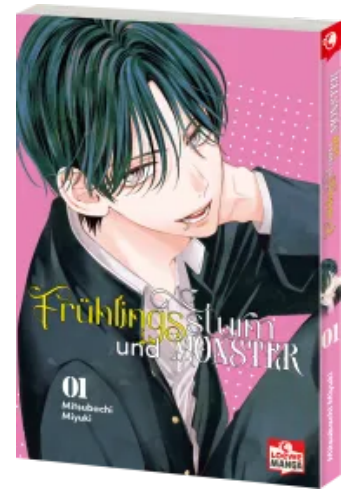
Frühlingssturm und Monster 01 Taschenbuch