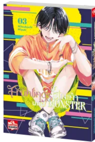
Frühlingssturm und Monster 03 Taschenbuch