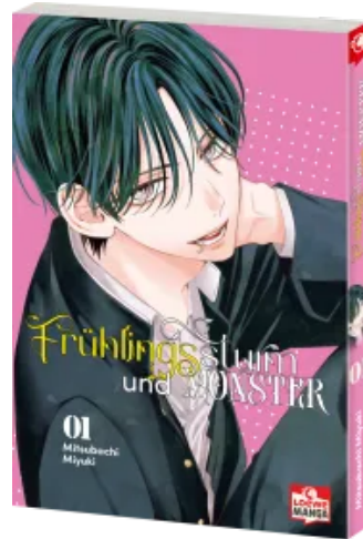
Frühlingssturm und Monster 01 Taschenbuch