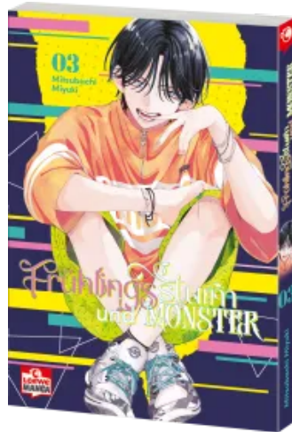
Frühlingssturm und Monster 03 Taschenbuch