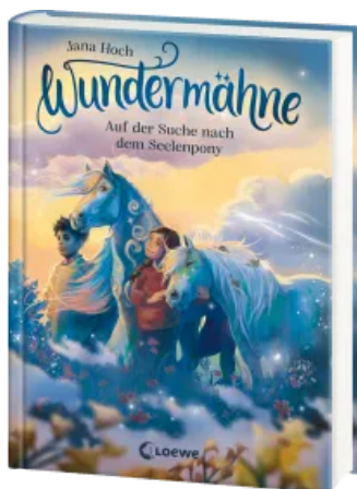
Wundermähne (Band 2) - Auf der Suche nach dem Seelenpony Hardcover