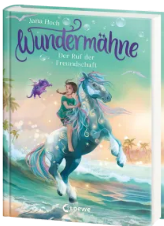
Wundermähne (Band 3) - Der Ruf der Freundschaft Hardcover