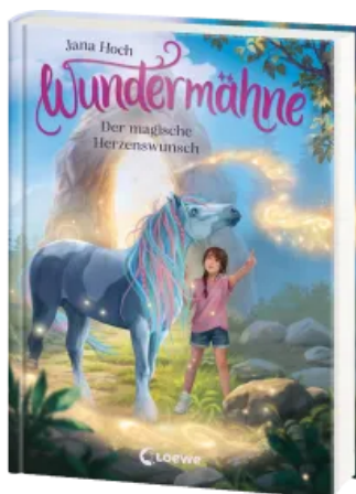
Wundermähne (Band 7) - Der magische Herzenswunsch Hardcover