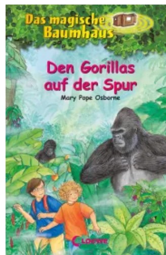
Das magische Baumhaus (Band 24) - Den Gorillas auf der Spur Hardcover