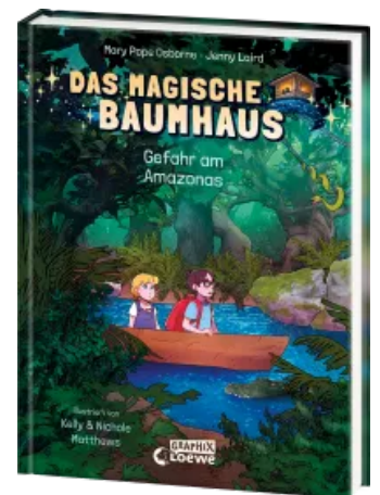
Das magische Baumhaus (Comic-Buchreihe, Band 6) - Gefahr am Amazonas Hardcover