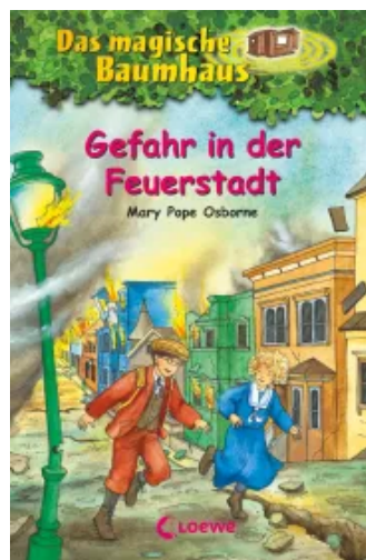
Das magische Baumhaus (Band 21) - Gefahr in der Feuerstadt Hardcover