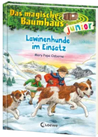
Das magische Baumhaus junior (Band 40) - Lawinenhunde im Einsatz Hardcover