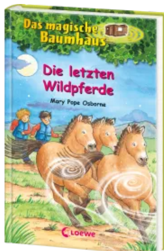
Das magische Baumhaus (Band 63) - Die letzten Wildpferde Hardcover