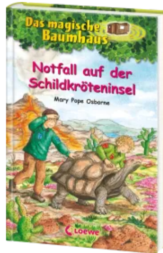
Das magische Baumhaus (Band 62) - Notfall auf der Schildkröteninsel Hardcover