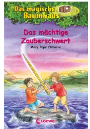
Das magische Baumhaus (Band 29) - Das mächtige Zauberschwert Hardcover