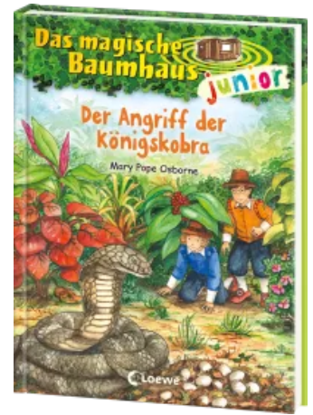
Das magische Baumhaus junior (Band 39) - Der Angriff der Königs cobra Hardcover