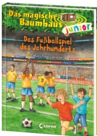
Das magische Baumhaus junior (Band 43) - Das Fußballspiel des Jahrhunderts Hardcover