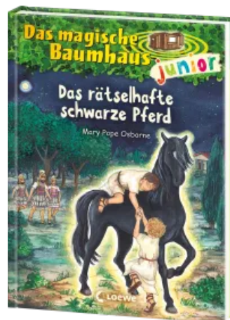
Das magische Baumhaus junior (Band 42) - Das rätselhafter schwarze Pferd Hardcover