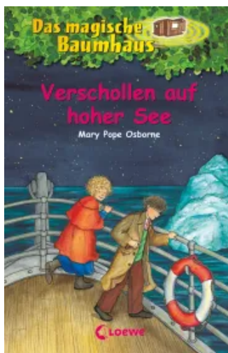
Das magische Baumhaus (Band 22) - Verschollen auf hoher See Hardcover