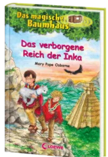
Das magische Baumhaus (Band 58) - Das verborgene Reich der Inka Hardcover