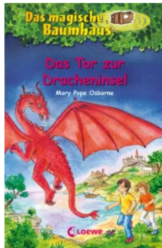
Das magische Baumhaus (Band 53) - Das Tor zur Dracheninsel Hardcover