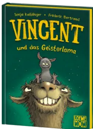
Vincent und das Geisterlama (Band 2) Hardcover