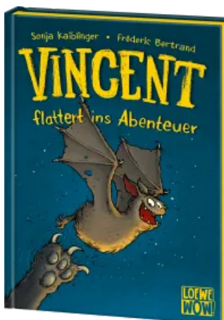
Vincent flattert ins Abenteuer (Band 1) Hardcover