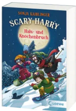
Scary Harry (Band 6) - Hals- und Knochenbruch Taschenbuch