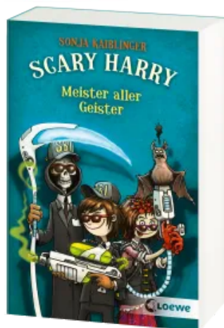
Scary Harry (Band 3) - Meister aller Geister Taschenbuch