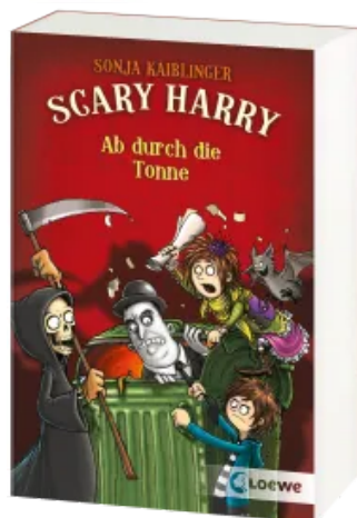
Scary Harry (Band 4) - Ab durch die Tonne Taschenbuch