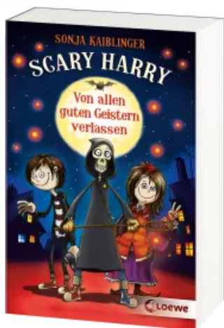
Scary Harry (Band 1) - Von allen guten Geistern verlassen Taschenbuch