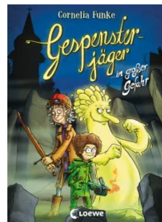
Gespensterjäger in großer Gefahr (Band 4) Hardcover