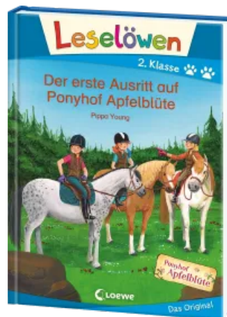
Leselöwen 2. Klasse - Der erste Ausritt auf Ponyhof Apfelblüte Hardcover