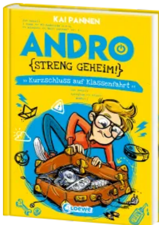
Andro, streng geheim! (Band 3) - Kurzschluss auf Klassenfahrt Hardcover