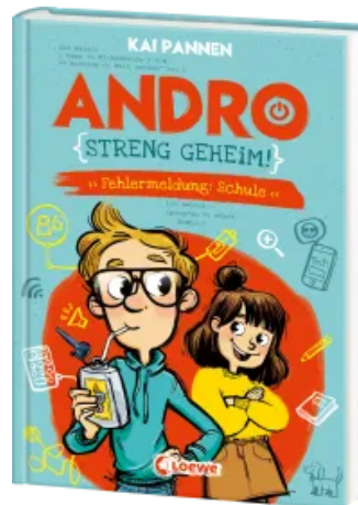
Andro, streng geheim! (Band 1) - Fehlermeldung: Schule Hardcover