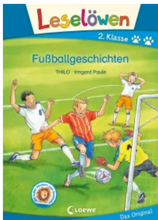
Leselöwen 2. Klasse - Ponygeschichten Hardcover