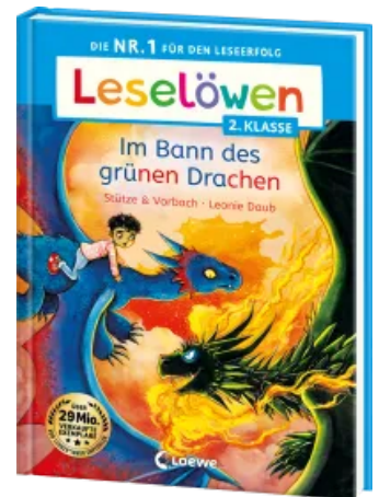
Leselöwen 2. Klasse - Im Bann des grünen Drachen Hardcover