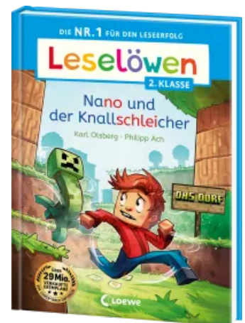
Leselöwen 2. Klasse - Nano und der Knallschleicher Hardcover