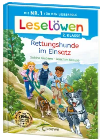
Leselöwen 2. Klasse - Rettungshunde im Einsatz Hardcover