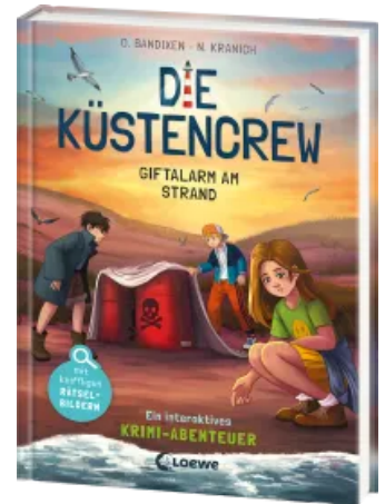
Die Küstencrew (Band 5) - Giftalarm am Strand Hardcover