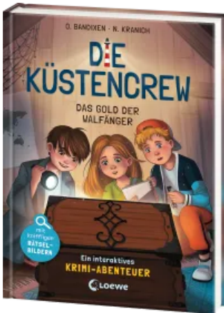
Die Küstencrew (Band 1) - Das Gold der Walfänger Hardcover