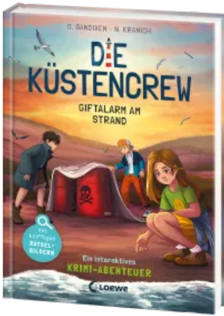
Die Küstencrew (Band 5) - Giftalarm am Strand Hardcover