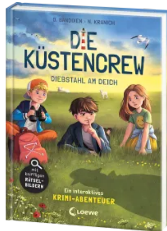
Die Küstencrew (Band 3) - Diebstahl am Deich Hardcover