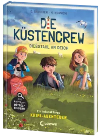
Die Küstencrew (Band 3) - Diebstahl am Deich Hardcover