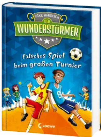
Der Wunderstürmer (Band 7) - Falsches Spiel beim großen Turnier Hardcover