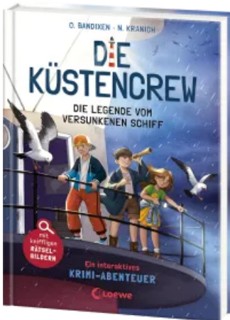
Die Küstencrew (Band 4) - Die Legende vom versunkenen Schiff Hardcover