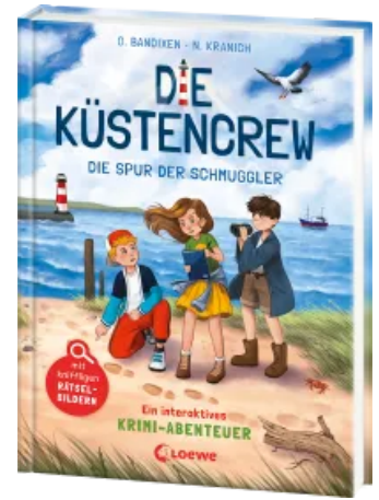
Die Küstencrew (Band 2) - Die Spur der Schmuggler Hardcover