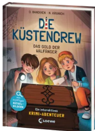
Die Küstencrew (Band 1) - Das Gold der Walfänger Hardcover