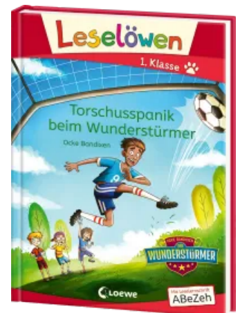
Leselöwen 1. Klasse - Torschusspanik beim Wunderstürmer Hardcover