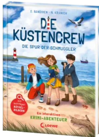
Die Küstencrew (Band 2) - Die Spur der Schmuggler Hardcover