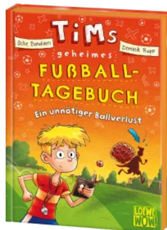
Tims geheimes Fußball- Tagebuch (Band 2) - Ein unnötiger Ballverlust Hardcover