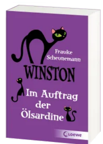
Winston (Band 4) - Im Auftrag der Ölsardine Taschenbuch