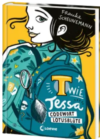
T wie Tessa (Band 2) - Codewort Lotusblüte Hardcover