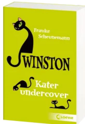
Winston (Band 5) - Kater Undercover Taschenbuch