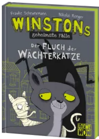
Winstons geheimste Fälle (Band 1) - Der Fluch der Wächterkatze Hardcover