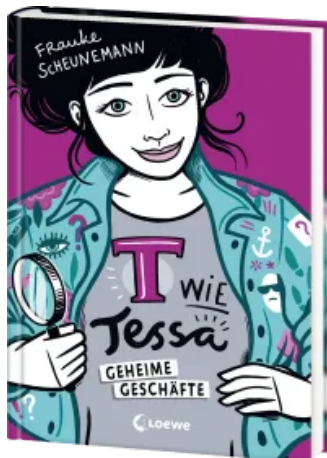
T wie Tessa (Band 3) - Geheime Geschäfte Hardcover