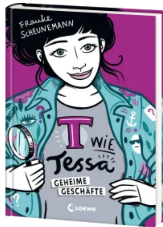
T wie Tessa (Band 3) - Geheime Geschäfte Hardcover