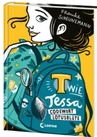
T wie Tessa (Band 2) - Codewort Lotusblüte Hardcover