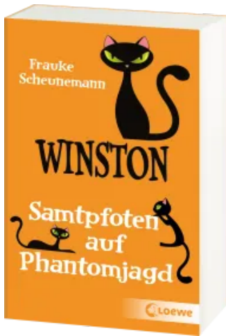
Winston (Band 7) - Samtpfoten auf Phantomjagd Taschenbuch