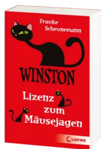
Winston (Band 6) - Lizenz zum Mäusejagen Taschenbuch