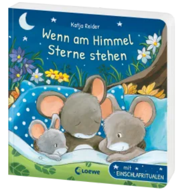
Wenn am Himmel Sterne stehen