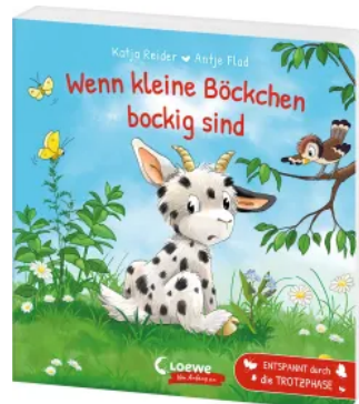
Wenn kleine Böckchen bockig sind