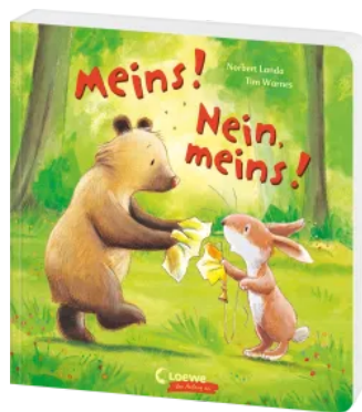
Meins! Nein, meins! Hardcover