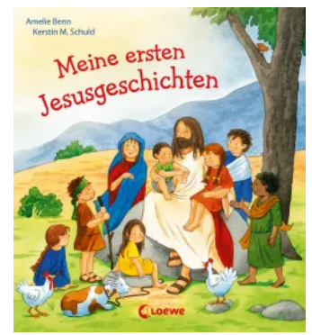
Meine ersten Jesusgeschichten Hardcover