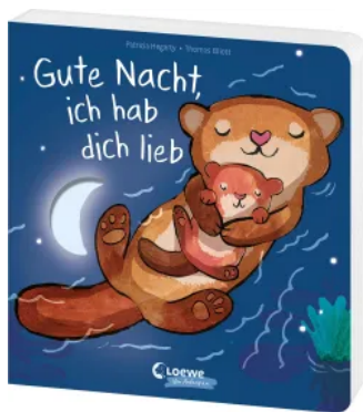
Gute Nacht, ich hab dich lieb Hardcover