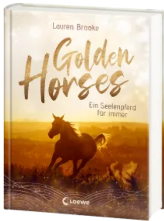
Golden Horses (Band 1) - Ein Seelenpferd für immer Hardcover