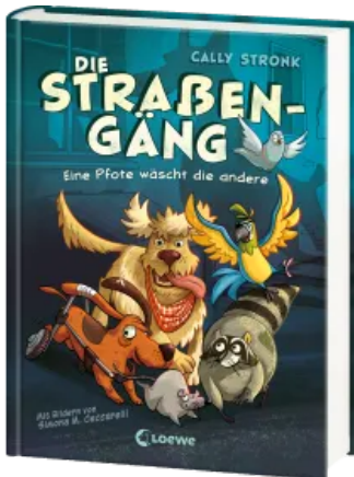
Die Straßengäng (Band 1) - Eine Pfote wäscht die andere Hardcover