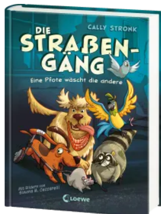
Die Straßengäng (Band 1) - Eine Pfote wäscht die andere Hardcover