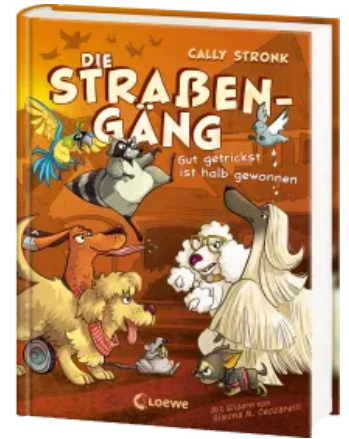
Die Straßengäng (Band 2) - Gut getrickst ist halb gewonnen Hardcover