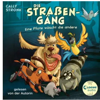
Die Straßengäng (Band 1) - Eine Pfote wäscht die andere Hörbuch