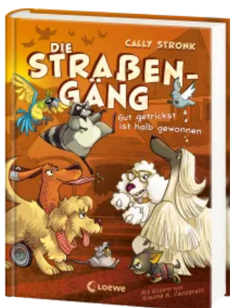
Die Straßengäng (Band 2) - Gut getrickst ist halb gewonnen Hardcover