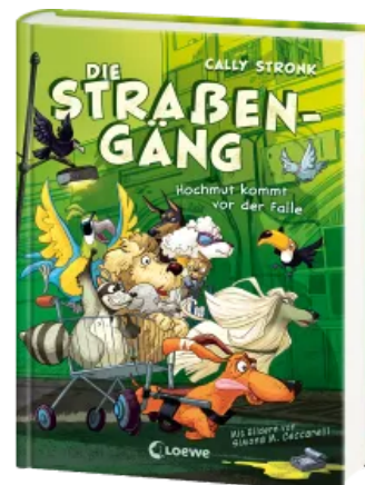
Die Straßengäng (Band 3) - Hochmut kommt vor der Falle Hardcover