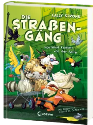
Die Straßengäng (Band 3) - Hochmut kommt vor der Falle Hardcover