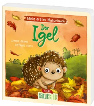
Mein erstes Naturbuch - Der Igel Hardcover