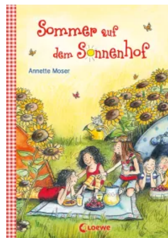
Sommer auf dem Sonnenhof Hardcover