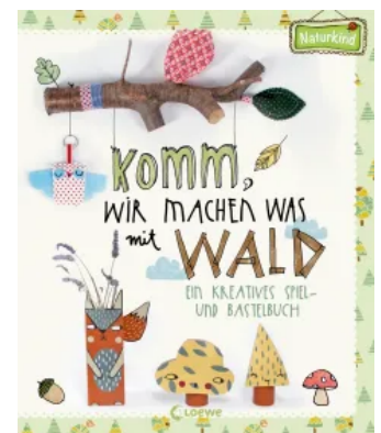
Komm, wir machen was mit Wald Hardcover