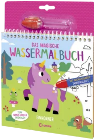
Das magische Wassermalbuch - Einhörner Hardcover