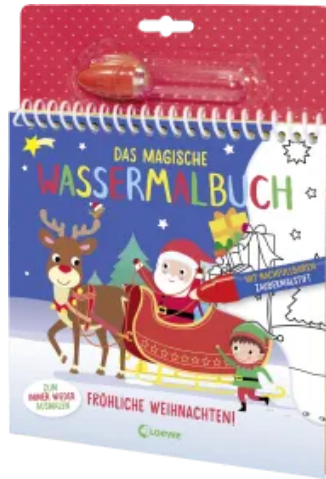
Das magische Wassermalbuch - Fröhliche Weihnachten! Hardcover