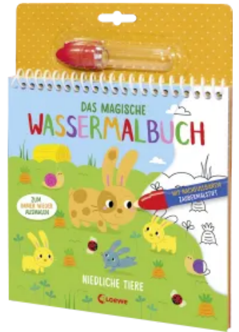
Das magische Wassermalbuch - Niedliche Tiere Hardcover