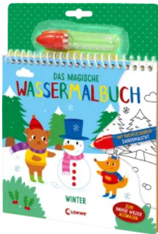
Das magische Wassermalbuch - Winter Hardcover