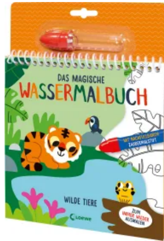
Das magische Wassermalbuch - Wilde Tiere Hardcover