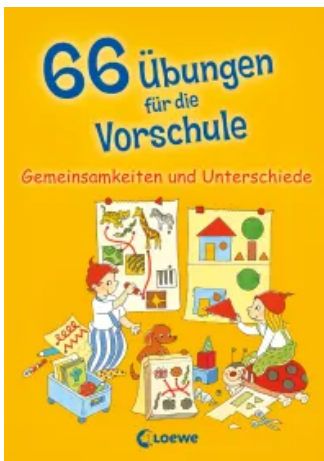
66 Übungen für die Vorschule - Gemeinsamkeiten und Unterschiede Taschenbuch