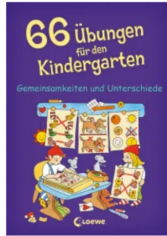
66 Übungen für den Kindergarten Taschenbuch