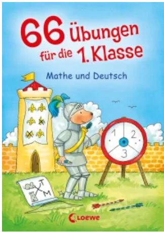
66 Übungen für die 1. Klasse - Mathe und Deutsch Taschenbuch