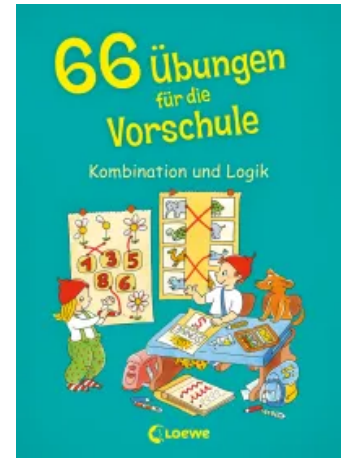
66 Übungen für die Vorschule Unbekannt