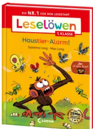
Leselöwen 1. Klasse - Jim ist mies drauf - Haustier-Alarm! Hardcover