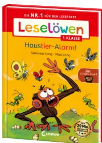
Leselöwen 1. Klasse - Jim ist mies drauf - Haustier-Alarm!