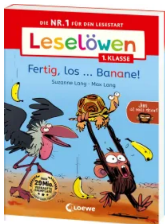
Leselöwen 1. Klasse - Jim ist mies drauf - Fertig, los...Banane!