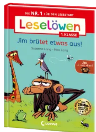
Leselöwen 1. Klasse - Jim ist mies drauf - Jim brütet etwas aus! Hardcover