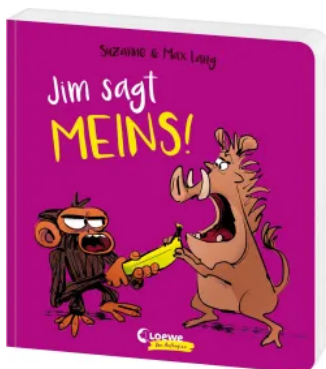
Jim sagt MEINS! Hardcover