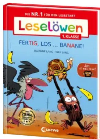
Leselöwen 1. Klasse - Jim ist mies drauf - Fertig, los ... Banane! (Großbuchstaben) Hardcover