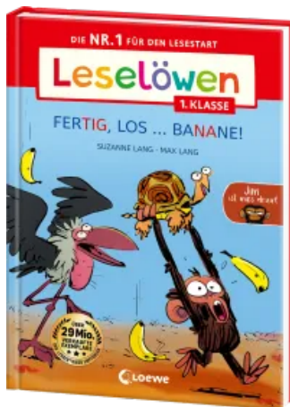
Leselöwen 1. Klasse - Jim ist mies drauf - Fertig, los ... Banane! (Großbuchstaben)