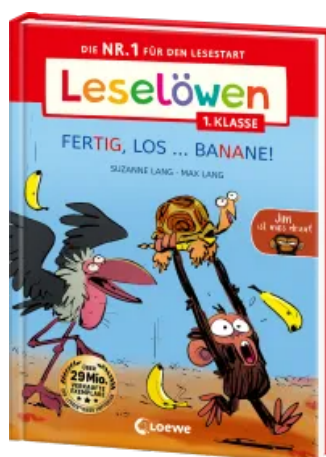
Leselöwen 1. Klasse - Jim ist mies drauf - Fertig, los ... Banane! (Großbuchstaben)