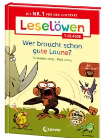
Leselöwen 1. Klasse - Jim ist mies drauf - Wer braucht schon gute Laune? Hardcover