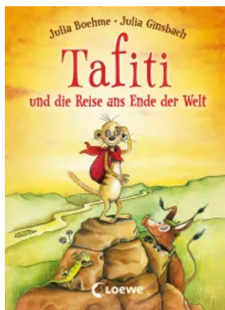
Tafiti und die Reise ans Ende der Welt (Band 1) Sonderausgabe