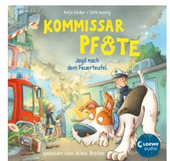
Kommissar Pfote (Band 8) - Jagd nach dem Feuerteufel Hörbuch