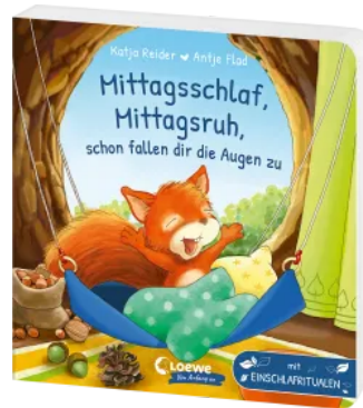
Mittagsschlaf, Mittagsruh, schon fallen dir die Augen zu Hardcover