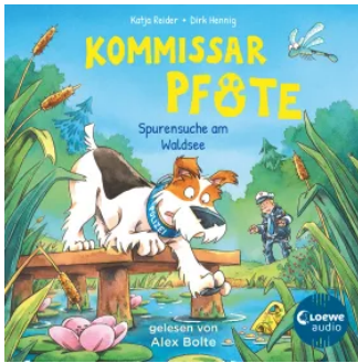
Kommissar Pfote (Band 7) - Spurensuche am Waldsee Hörbuch