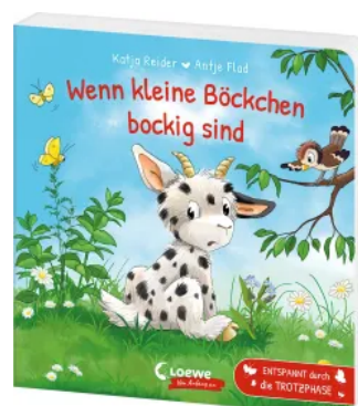
Wenn kleine Böckchen bockig sind Hardcover