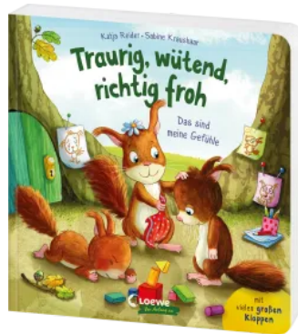
Traurig, wütend, richtig froh - das sind meine Gefühle Hardcover