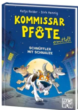
Kommissar Pfote ermittelt (Band 1) - Schnüffler mit Schnauze Hardcover