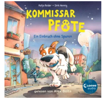
Kommissar Pfote (Band 6) - Ein Einbruch ohne Spuren Hörbuch