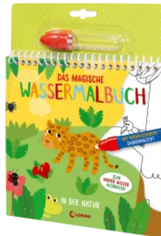
Das magische Wassermalbuch - In der Natur Hardcover