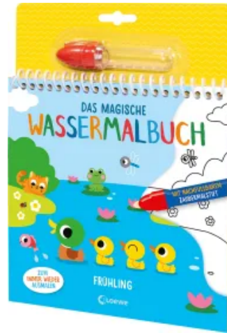
Das magische Wassermalbuch - Frühling Hardcover