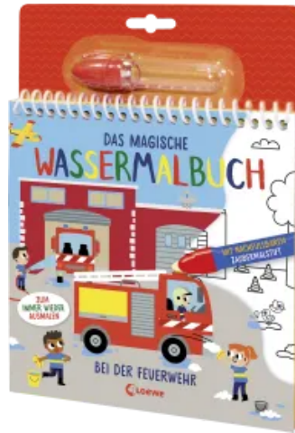
Das magische Wassermalbuch - Bei der Feuerwehr Hardcover