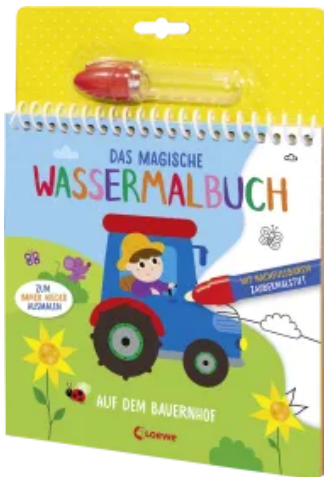
Das magische Wassermalbuch - Auf dem Bauernhof Hardcover