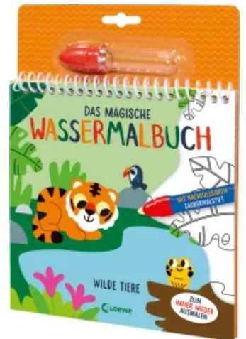
Das magische Wassermalbuch - Wilde Tiere Hardcover