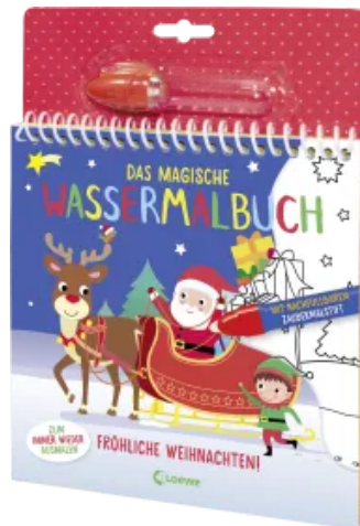
Das magische Wassermalbuch - Fröhliche Weihnachten! Hardcover