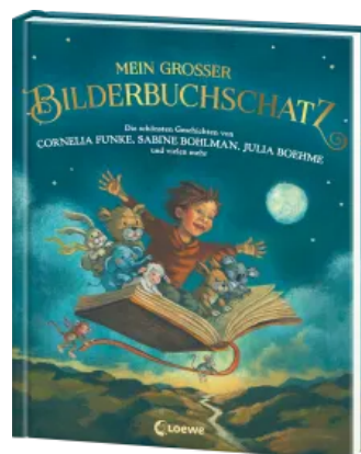
Mein großer Bilderbuchschatz Hardcover