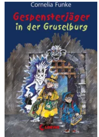
Gespensterjäger in der Gruselburg Hardcover