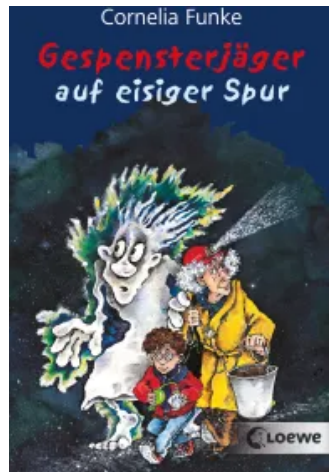
Gespensterjäger auf eisiger Spur Taschenbuch