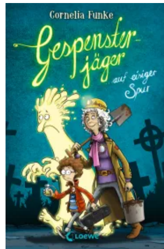
Gespensterjäger auf eisiger Spur (Band 1) Hardcover