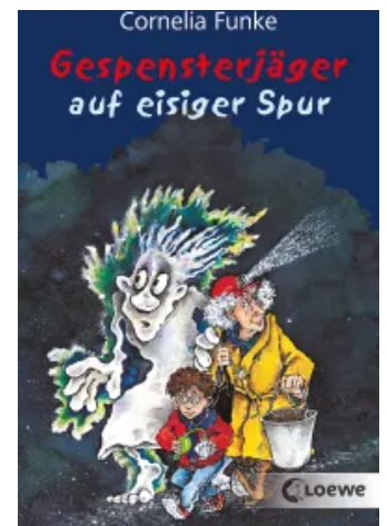
Gespensterjäger auf eisiger Spur (Band 1) Taschenbuch