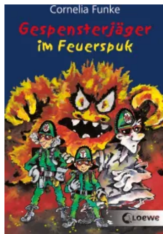
Gespensterjäger im Feuerspuk (Band 2) Taschenbuch