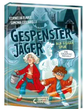
Gespensterjäger auf eisiger Spur (Band 1) - Die Graphic Novel Hardcover