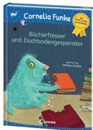
Bücherfresser und Dachbodengespenster Hardcover