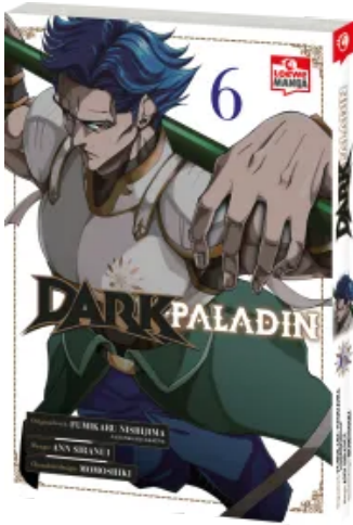
Dark Paladin 06 Taschenbuch