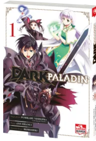
Dark Paladin 01 Taschenbuch