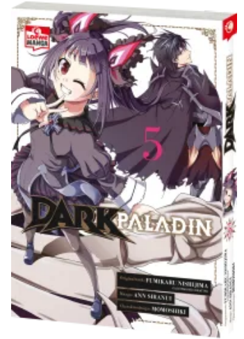
Dark Paladin 05 Taschenbuch