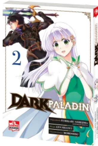
Dark Paladin 02 Taschenbuch