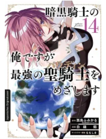
Dark Paladin 14 Taschenbuch