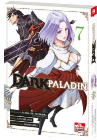
Dark Paladin 07 Taschenbuch