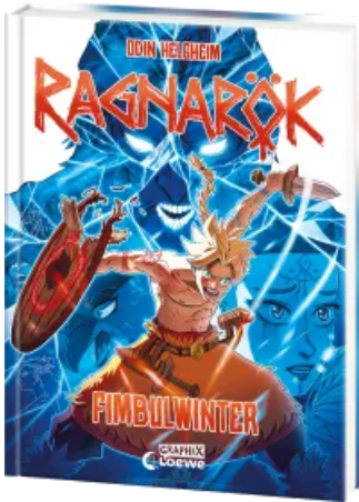
Ragnarök (Band 2) - Fimbulwinter Hardcover