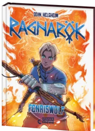
Ragnarök (Band 1) - Fenriswolf Hardcover