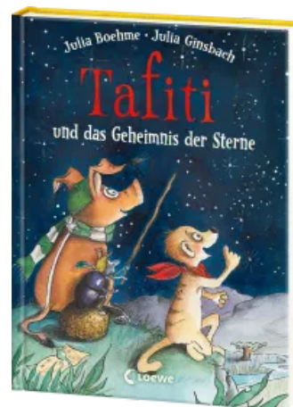
Tafiti und das Geheimnis der Sterne (Band 14) Hardcover