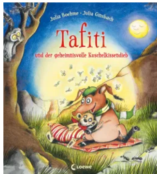
Tafiti und der geheimnisvolle Kuschelkissendieb Hardcover