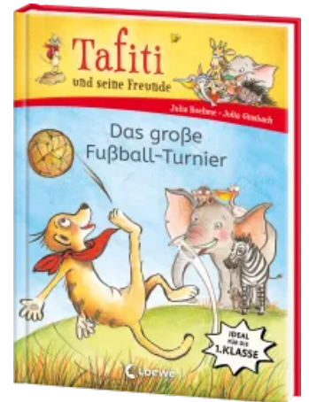
Tafiti und seine Freunde (Band 1) - Das große Fußball-Turnier Hardcover