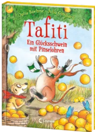
Tafiti (Band 24) - Ein Glücksschwein mit Pinselohren Hardcover