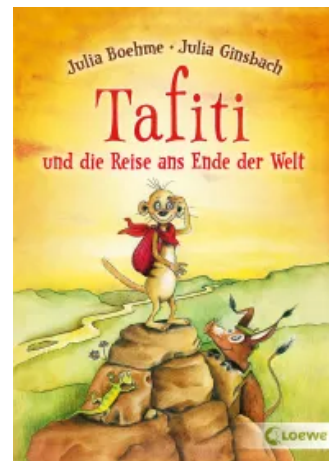
Tafiti und die Reise ans Ende der Welt (Band 1) Sonderausgabe