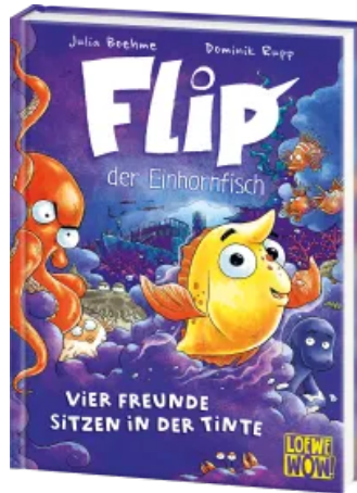
Flip, der Einhornfisch (Band 2) - Vier Freunde sitzen in der Tinte Hardcover