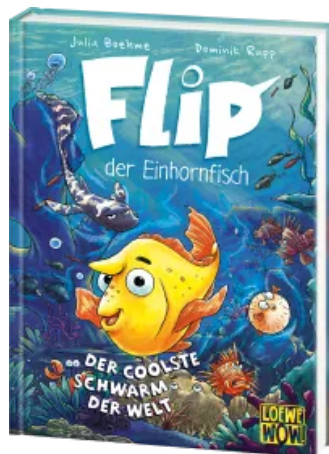
Flip, der Einhornfisch (Band 1) - Der coolste Schwarm der Welt Hardcover