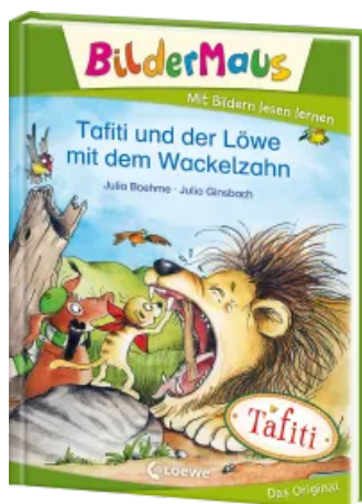
BilderMaus - Tafiti und der Löwe mit dem Wackelzahn Hardcover