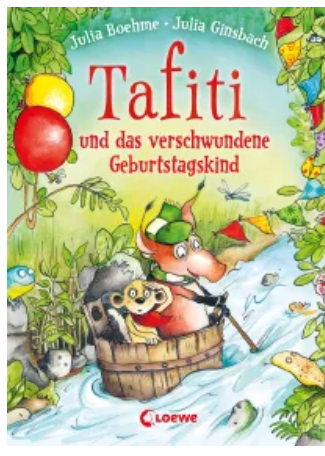
Tafiti und das verschwundene Geburtstagskind (Band 10) Hardcover