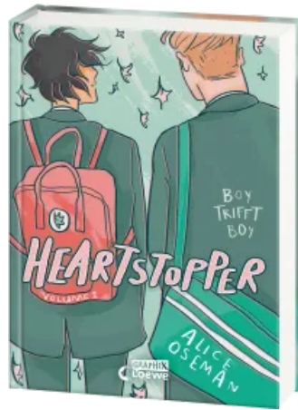
Heartstopper Volume 1 (deutsche Hardcover-Ausgabe) Hardcover