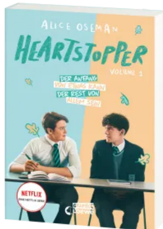
Heartstopper Volume 1 Taschenbuch