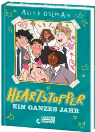
Heartstopper - Ein ganzes Jahr (Yearbook) Hardcover