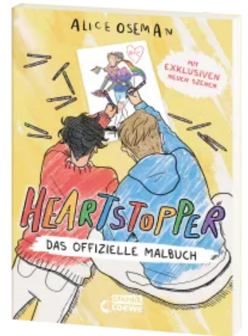
Heartstopper - Das offizielle Malbuch Taschenbuch