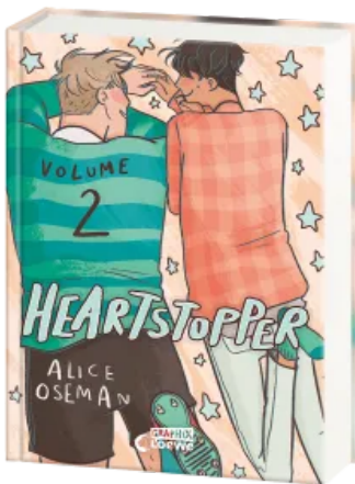
Heartstopper Volume 2 (deutsche Hardcover-Ausgabe) Hardcover