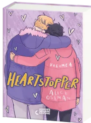
Heartstopper Volume 4 (deutsche Hardcover-Ausgabe) Hardcover