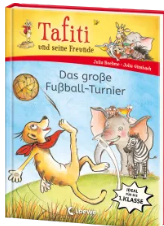
Tafiti und seine Freunde (Band 1) - Das große Fußball-Turnier Hardcover