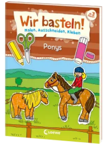
Wir basteln! - Malen, Ausschneiden, Kleben - Ponys Taschenbuch