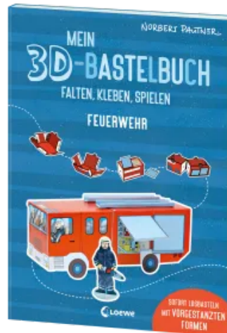
Mein 3D-Bastelbuch - Falten, kleben, spielen - Feuerwehr Taschenbuch