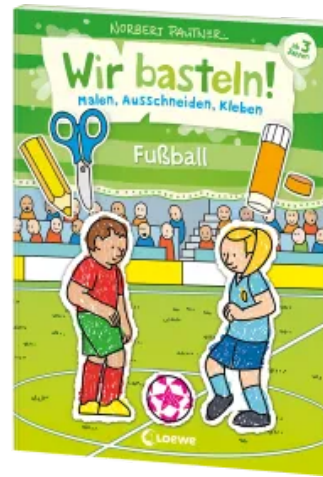
Wir basteln! - Malen, Ausschneiden, Kleben - Fußball Taschenbuch