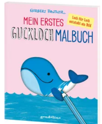
Mein erstes Guckloch- Malbuch (Wal) Taschenbuch