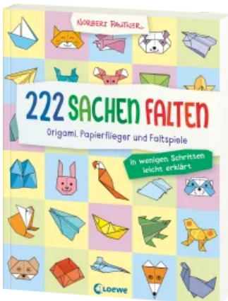
222 Sachen falten - in wenigen Schritten leicht erklärt Taschenbuch