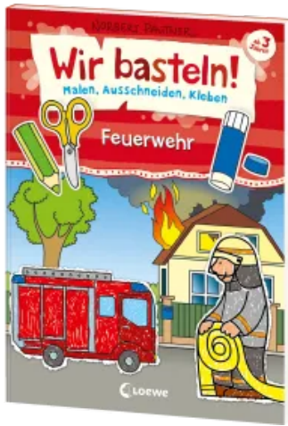
Wir basteln! - Malen, Ausschneiden, Kleben - Feuerwehr Taschenbuch