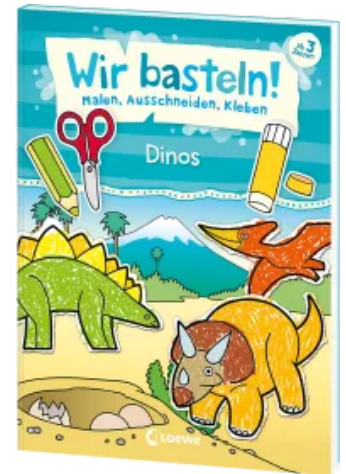
Wir basteln! - Malen, Ausschneiden, Kleben - Dinos Taschenbuch