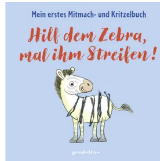
Hilf dem Zebra, mal ihm Streifen! Mein erstes Mitmach- und Kritzelbuch Hardcover