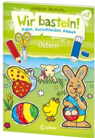
Wir basteln! - Malen, Ausschneiden, Kleben - Ostern Taschenbuch