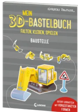
Mein 3D-Bastelbuch - Falten, kleben, spielen - Baustelle Taschenbuch