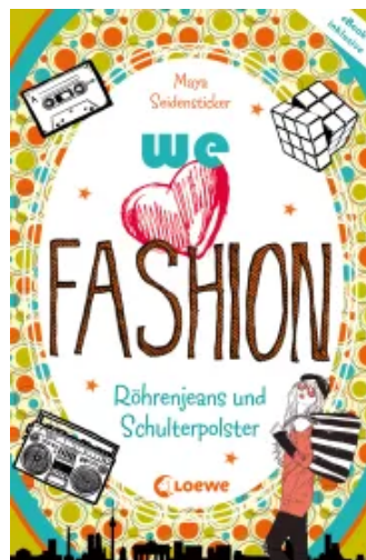
we love fashion (Band 1) – Röhrenjeans und Schulterpolster Paperback